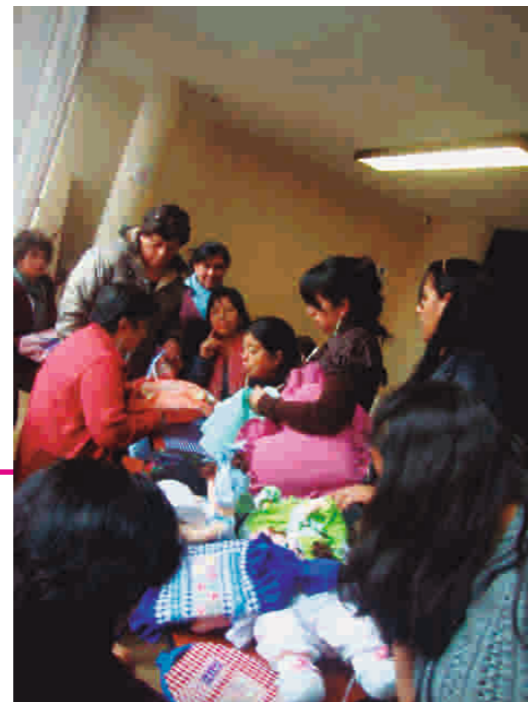
Artesanías con diseños y grafías ancestrales vereda Muellamues - Guachucal