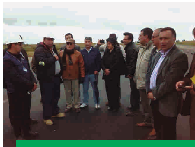
Junta directiva en visita a obras de infraestructura en el aeropuerto San Luis, veeduría presidida por la Cámara de Comercio de Ipiales.