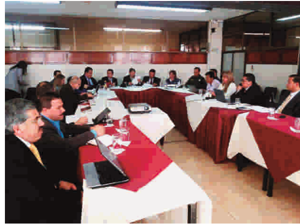
Reunión con autoridades del orden nacional, departamental y municipal trabajando sobre los temas de facilitación turística y comercial en fronteras.