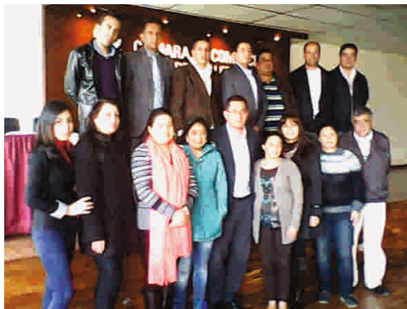
Gerencia para estaciones de servicio - febrero 24, 25 y 26