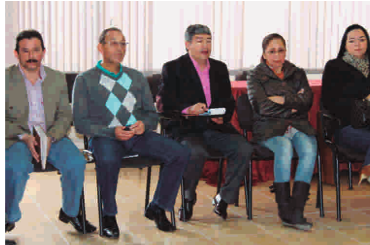
Reunión con autoridades discusión soat para turistas ecuatorianos