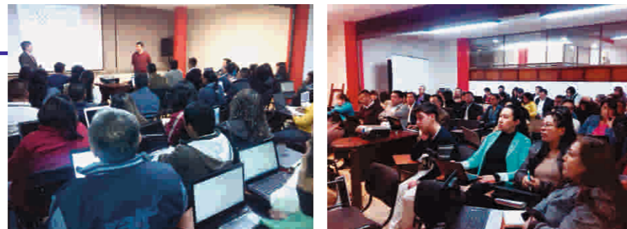
Diplomado en Excel Junio 18