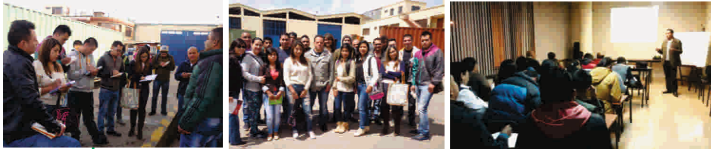
Técnico en Logística y Distribución Aduanera - Abril 11