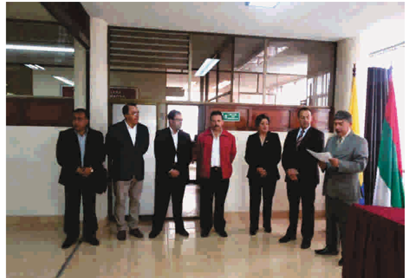
Apertura de elección de Junta Directiva con la presencia del Alcalde del municipio de Ipiales

Con un total de 208 votos, los empresarios afiliados e inscritos a la Cámara de Comercio de Ipiales eligieron los miembros de la nueva Junta Directiva por un período de cuatro años, que inició en el mes de enero de 2015.