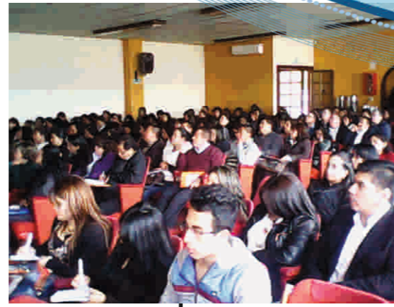
Reforma y actualización tributaria - Febrero 5